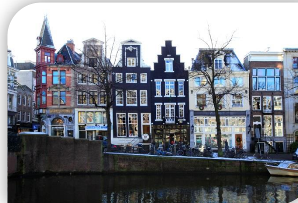
Keizersgracht 504, Amsterdam