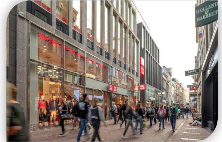
Kalverstraat 11-17, Amsterdam