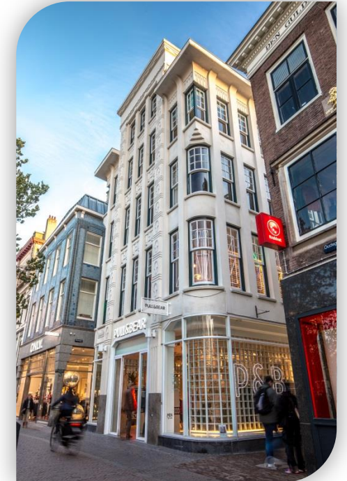
Oudegracht 161, Utrecht