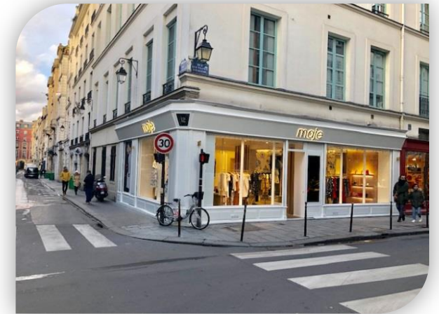
Rue des Francs Bourgeois 12, Parijs