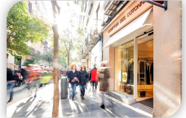
Calle de Fuencarral 27, Madrid