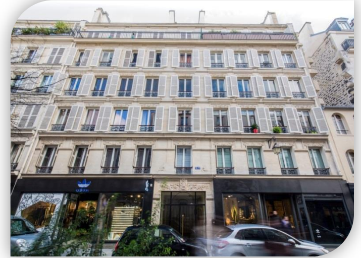
Rue des Rosiers 3, Parijs