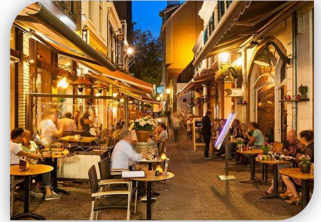
Drieharingstraat 2-8, 14-18 en 22, Utrecht