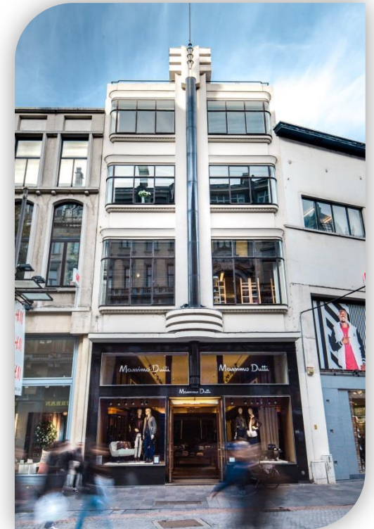
Meir 99, Antwerpen