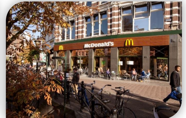
Oudegracht 136, Utrecht