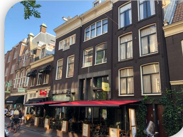
Reguliërsdwarstraat 80-84, Amsterdam